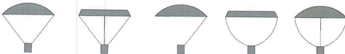
Figura 1 – Modelos de referência